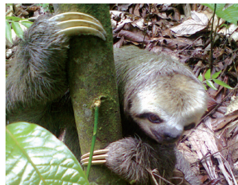
Perezoso o perico ligero

den observar gaviñanes, búhos crestados y varias especies de colibríes, tangaras y loros. Con un poco de suerte se puede ver el jacamar grande, un ave de color cobrizo y gran pico, muy buscado y admirado por los ornitólogos y observadores de aves. Alrededor del refugio se asientan varias comunidades afroecuatorianas.