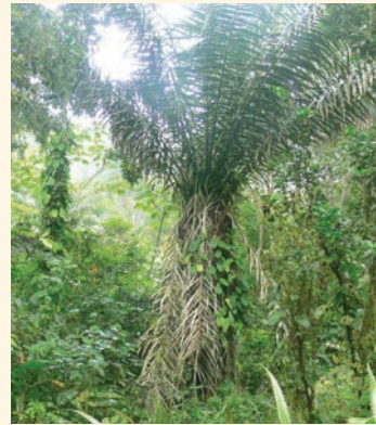
Palma de tagua

Desde épocas remotas, la biodiversidad terrestre y marina facilitó la vida de los antiguos pobladores al proveerles alimento, refugio y varios utensilios para sus actividades cotidianas. Los grupos humanos que aquí han habitado desarrollan prácticas de manejo que no han eliminado cobertura vegetal de las colinas circundantes. Sus pobladores han incorporado prácticas agroforestales interesantes, como el cultivo de sombra de frutales, cacao y café; también han incurrido en el cultivo y manejo de especies propias de la zona como son la tagua y la paja toquilla, con las cuales se fabrican varias artesanías. Estas prácticas de manejo ancestrales facilitan que la vegetación de sus colinas mantenga su función vital: cap-