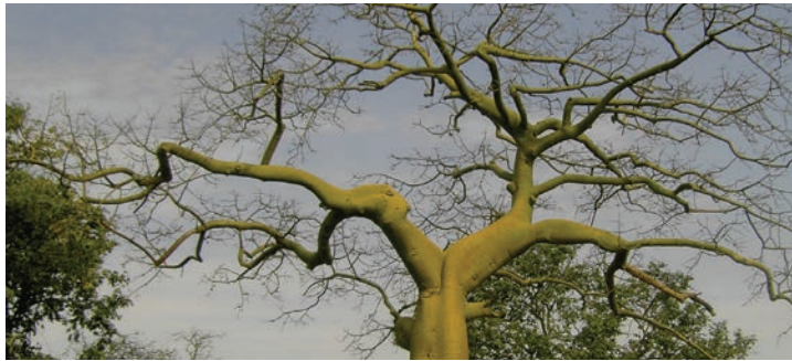
Bosque de ceibos

y es una forma de adaptación natural que han desarrollado las plantas para evitar la pérdida del agua durante los meses de mayor incidencia de los rayos solares. Algunos de los árboles de esos ambientes son chala, porotillo, molinillo, palo santo, ceibo y sebastián, y también hay palmas como tagua y mocora.