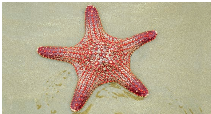
Estrella cojín panámica

En el área marina adyacente predominan las aguas poco profundas (hasta los 50 metros), lugar en donde se encuentra una gran variedad de organismos, especialmente invertebrados. Entre los peces, que conforman el grupo marino más estudiado hasta la fecha, se han registrado cerca de 40 especies, figurando entre las más conocidas la corvina de roca, el camotillo, la perla, la cherna, la sierra, el pargo y la carita. El área marina también es frecuentada por mamíferos como la ballena jorobada y varias especies de delfines.