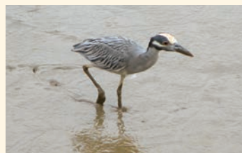
Garza nocturna cangrejera