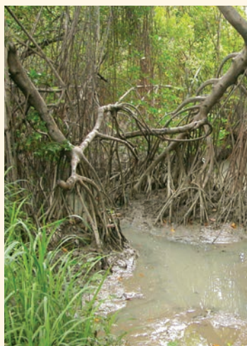
Raíces aéreas del manglar

No se conoce el estado de su población, pero sin duda son muy importantes para el mantenimiento del equilibrio ecológico de ese ecosistema. Los libros de los viajeros al Ecuador, desde la época colonial hasta la primera mitad del siglo XX, hablan de la abundancia del cocodrilo en las riberas de los ríos y esteros del Golfo; sin embargo, la cacería por la piel y el temor a sus ataques redujeron sus poblaciones hasta casi extinguirlo. Entre las especies que residen en el área pero que son difíciles de observar están algunos mamíferos como el zorro cangrejero, la nutria de río y el flor de balsa u oso hormiguero pequeño.