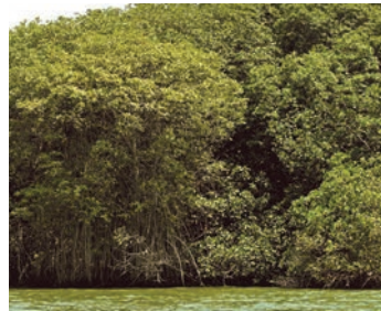
Bosque de manglar

El agua dulce que alimenta esta zona proviene de la cuenca del río Chongón y de las escorrentías de las colinas de la ciudad. El agua salada, en cambio, sube por el estuario y entra por esteros como Mongón, Plano Seco y El Salado.