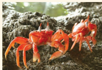
Cangrejos en el lodo