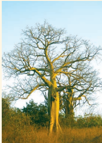
Arbol de ceibo

Otra característica especial es que en los bosques secos del sur del Ecuador se encuentran varias especies endémicas, en especial aves. Se destaca también la presencia del sapo bocón tumbesino.