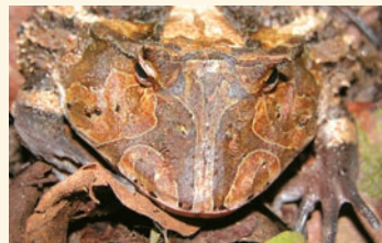
Sapo bocón tumbesino