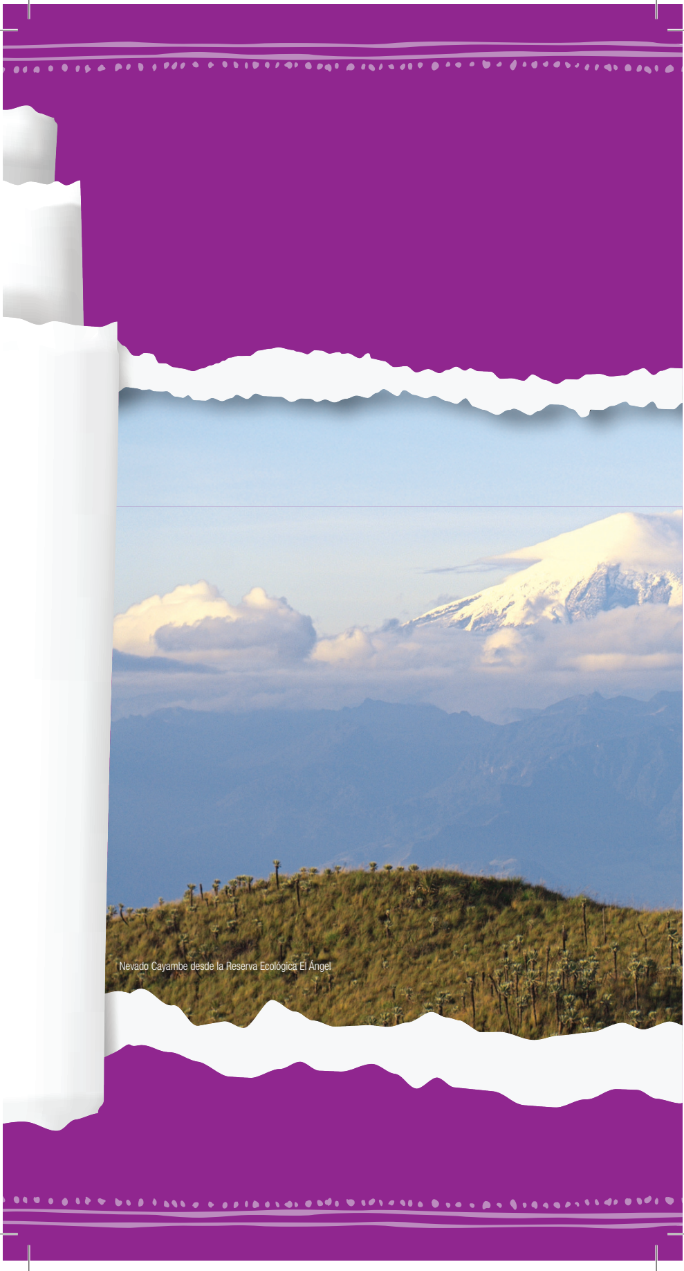
Nevado Cayambe desde la Reserva Ecológica El Ángel