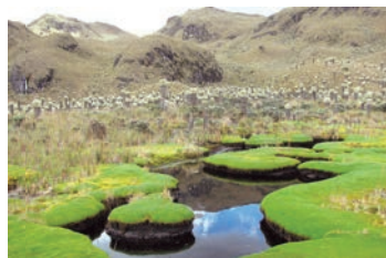
Almohadillas en humedal