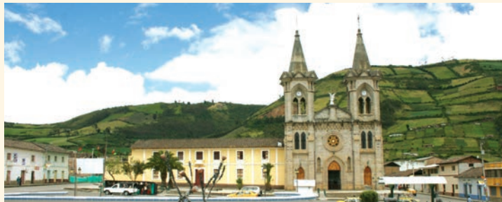
Ciudad de El Ángel

Lo que es la actual reserva fue parte del territorio de un grupo indígena preincaico, los Pastos o Past-Awá, aparentemente relacionados cercanamente con los actuales Awá de tierras bajas hacia el occidente. Los Pastos resistieron duramente el embate de Huayna Cápac para caer solamente ante el avance español. Actualmente hay un renacimiento de la cultura Pasto entre los habitantes de poblaciones colindantes con la reserva. Muchos de los topónimos y apellidos de la región atestiguan este pasado, y se pueden encontrar petroglifos y otros signos de ocupación