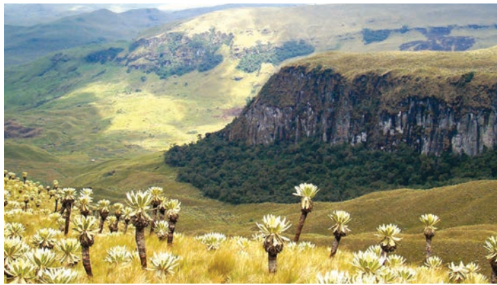
Páramo con frailejones y manchones de bosque

tran zonas con pendientes pronunciadas y acantilados impresionantes, bajo las cuales se extienden grandes planicies. En este paisaje, esculpido por los volcanes y los glaciares, es donde la paja de páramo, los frailejones y un sinnúmero de plantas y animales adaptados a las alturas tropicales crecen sin problema. La reserva protege también la naciente de muchos ríos que alimentan el río El Ángel, entre ellos los ríos Potrerillos, Rasococha, Chilmá, Grande, Santiaguillo y Voladero.