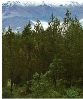
Plantación de pinos

Aquí funcionó por muchos años la Estación Forestal El Boliche donde se realizaban prácticas de adaptación y manejo agroforestal con varias especies.