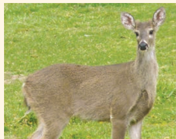
Venado de cola blanca