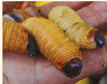
Gusano de la chonta

Colonso – Chalupas protege principalmente páramos y bosques montanos de las estribaciones amazónicas. En los bosques existen árboles de más de 400 años de edad, tiempo que demoraron en alcanzar diámetros superiores a 1 m; los chuchos, por ejemplo, tienen una de las copas más altas de bosque, y en ellos vive una importante variedad de aves. Además, dentro del bosque aún se pueden observar árboles de canelo e ishpingo, que son saborizantes naturales. El canelo es un árbol con madera de consistencia dura, que era extraído para la construcción de casas. Hasta la fecha se ha registrado 40 frutos comestibles dentro de esta área. Una palma que tiene varios usos es el pambil: antes se usaban las hojas para hacer flechas de cacería, sus frutos se usan para hacer artesanías, y de sus troncos se recolecta el chontacuro, una larva comestible.