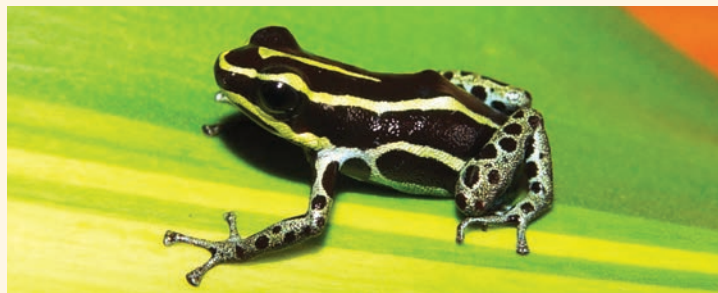
Rana venenosa ventrimanchada

chada ( Dendrobates ventrimaculatus ), se encuentra representada en el logotipo del área protegida.