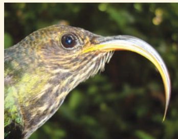
Pico de hoz puntiblanco

Dentro de la fauna destaca el grupo de los anfibios; precisamente una de sus especies, la rana venenosa ventriman-