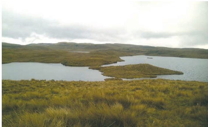
Sistema lacustre Piscacochas

lugar a la formación de lagunas y al desarrollo de frailejones gigantes, otra de las marcas de identidad del parque. En este terreno escarpado no sobresale un solo pico, pero la elevación más importante es el Cerro Hermoso o Yúrac Llanganati, de 4.571 metros de altitud. En el área nacen los ríos Negro, afluente del Pastaza, y Mulatos, afluente del Napo.