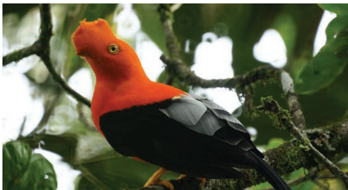
Gallo de la peña