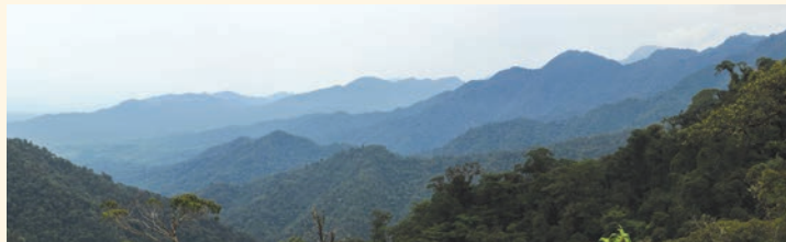
Imagen característica de la cordillera de Los Llanganates

Los Llanganates están cubiertos por un halo de misterio, no solo por lo inaccesible de su terreno y la constante neblina que cubre bosques y páramos, sino por la leyenda del tesoro de Atahualpa. El saber popular cuenta que el general Rumiñahui, escondió ahí parte del oro del rescate que los españoles pedían por Atahualpa, cuando éste fue asesinado. Desde entonces, numerosos aventureros han intentado encontrar el tesoro y se han perdido en los vericuetos de las montañas, alimentando la leyenda. Se sabe que los pueblos originales practicaban minería de oro en la zona de los Llanganates, de lo que quedan rastros de los caminos utilizados para transportar el metal. A decir de la leyenda,