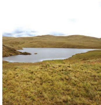
Una de las lagunas del área protegida

Quimsacocha, que significa “Tres Lagunas”, es una planicie de vegetación y suelo de páramo, una extensa esponja que almacena gran cantidad de agua. Se ubica al sur del Parque Nacional Cajas y dada la altitud a las que se encuentra, su clima es predominantemente frío. Cuando el sol brilla y calienta en los páramos, la temperatura puede elevarse hasta los 20 °C. Pero cuando las nubes lo bloquean, el frío recupera terreno inmediatamente. En la noche es normal que la temperatura baje a menos de 5 °C y en ocasiones puede llegar a producir heladas.