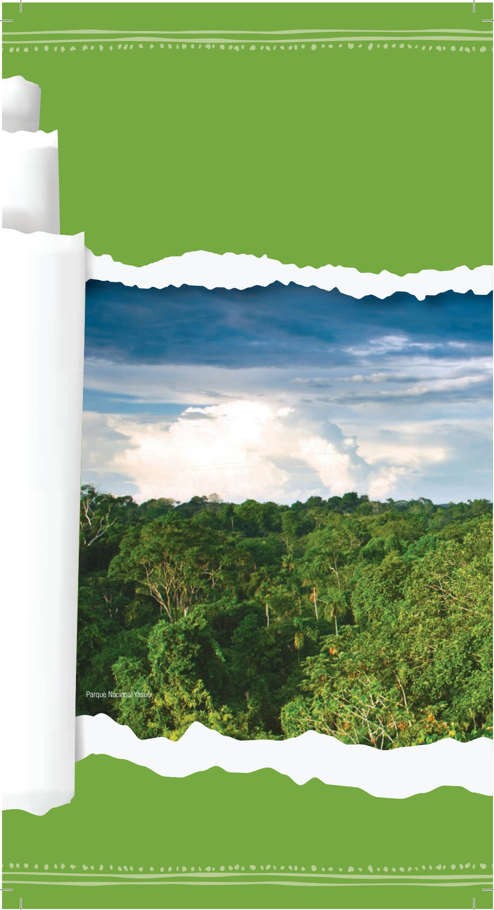
Parque Nacional Yasuni