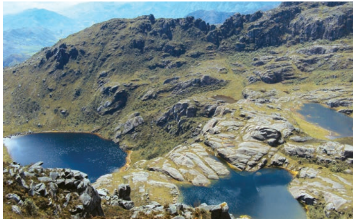
Sistema lacustre del P.N. Yacuri

Otro aspecto que llama la atención es el uso tradicional que se ha dado a varias lagunas del parque, así como también la creencia cultural de arrojar monedas a las lagunas a fin de atraer la buena suerte; no obstante, esta no es una actividad que está de acuerdo con los principios de conservación y es necesario exhortar a los visitantes para que la eviten.