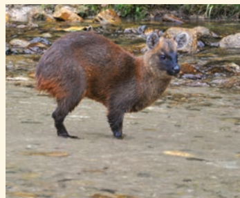
Venado colorado o soche