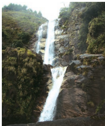
Cascada La Chorrera

El Parque Nacional Yacuri presenta una topografía con pendientes donde existe un importante sistema de lagunas agrupadas, tales como: laguna de Yacuri, Las Arrebiatadas, Los Patos, Las Negras, Coloradas, Arenal, Huicundos, y Laguna Cox, entre los más importantes. La mayor parte de su superficie presenta un relieve escarpado. Sus formaciones geológicas son variadas y datan de distintos períodos geológicos. Dado lo irregular de su superficie, en esta área protegida solamente se pueden realizar actividades relacionadas con la conservación.